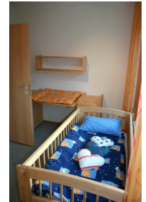
(Wohnbeispiel Küche und Kinderzimmer)